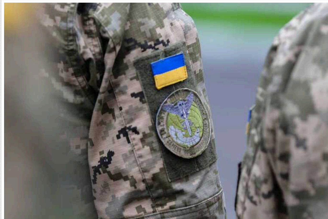
Що кажуть у ГУР про "підготовку РФ до наступу у Харківській області" про яку пише The Telegraph

Видання The Telegraph пише, що Росія нібито готується до нового наступу в Харківській області, який буцімто може відбутися 15 січня після масованих обстрілів. В ГУР цю інформацію не підтверджують, але зауважують, що певне накопичення сил ворог все ж здійснює.