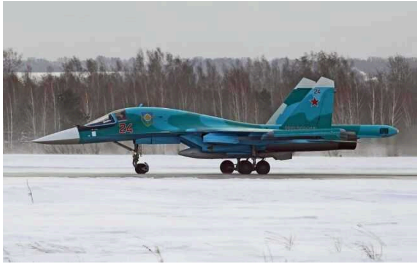
Виробляють небагато, втрата кожного літака – це дуже серйозно, – Ігнат про російські винищувачі Су-34

Росія продовжує виробляти винищувачі Су-34, однак у малій кількості через санкції. Тому втрата кожного літака для них є дуже серйозною.