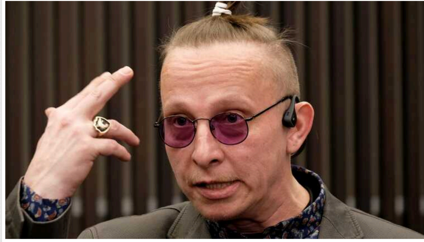
Російський актор Охлобистін закликав канонізувати терористів "ДНР" Захарченка, "Гіві" та "Моторолу"

Зірка серіалу "Інтерни", російський актор-путініст Іван Охлобистін, який у минулому був священником, запропонував канонізувати як святих трьох бойовиків, які наставили зброю на українців. Мова йде про ексватажка "ДНР" Олександра Захарченка, ліквідованого в 2018 році, а також вбитих терористів Арсена Павлова на позивний "Моторола" та Михайла "Гіві" Толстих.