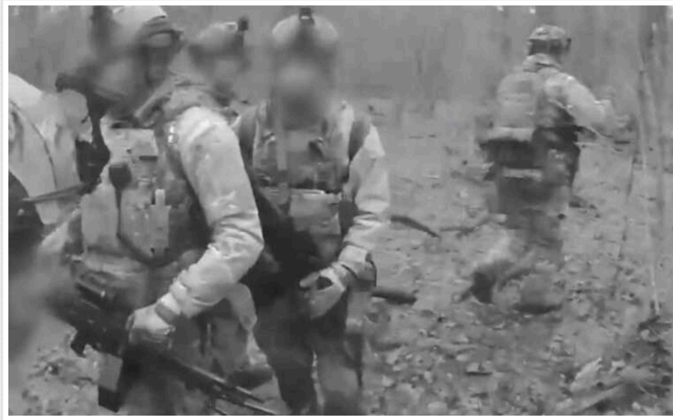
Спецоперацію у Белгородській області провело ГУР: у росіян є втрати

Головне управління розвідки Міноборони провело спецоперацію у Белгородській області перед приїздом на російські позиції вищого військового керівництва.