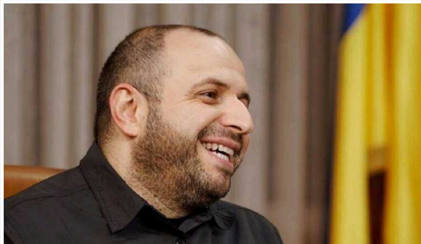
Умеров та міністр оборони Польщі провели продуктивні переговори

Міністр оборони України Руслан Умеров провів телефонні переговори з польським колегою Владиславом Косіняком-Камішем.