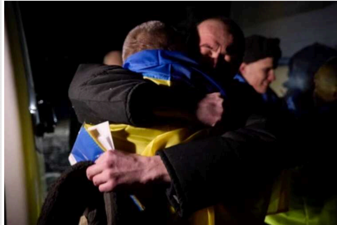
У якому стані 230 українців, які повернулися з російського полону, 90% з яких зазнали тортур

Майже у всіх звільнених із російського полону українців виявили ушкодження травної системи та порушення опорно-рухового апарату. У багатьох екстремців є проблеми з ногами та зубами.