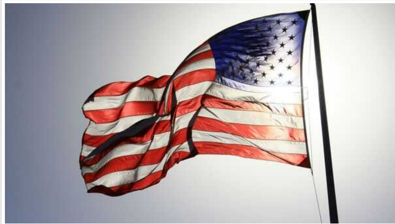
Сполучені Штати розробляють план дій у разі розширення близькосхідного конфлікту, – ЗМІ

В адміністрації президента Джо Байдена розробляють плани реагування США на випадок того, якщо війна в Газі переросте в ширшій і затяжний регіональний конфлікт.