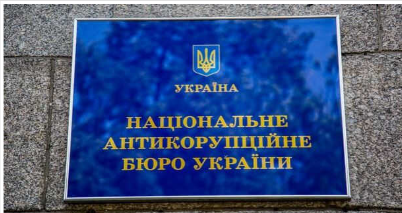
НАЗК почало процедуру моніторингу способу життя президента "Енергоатому"

Нацагентство з питань запобігання корупції розпочало процедуру моніторингу способу життя президента "Енергоатому" Петра Котіна, на тещу якого у 2023 році було записано масток під Києвом за майже 7 млн грн.