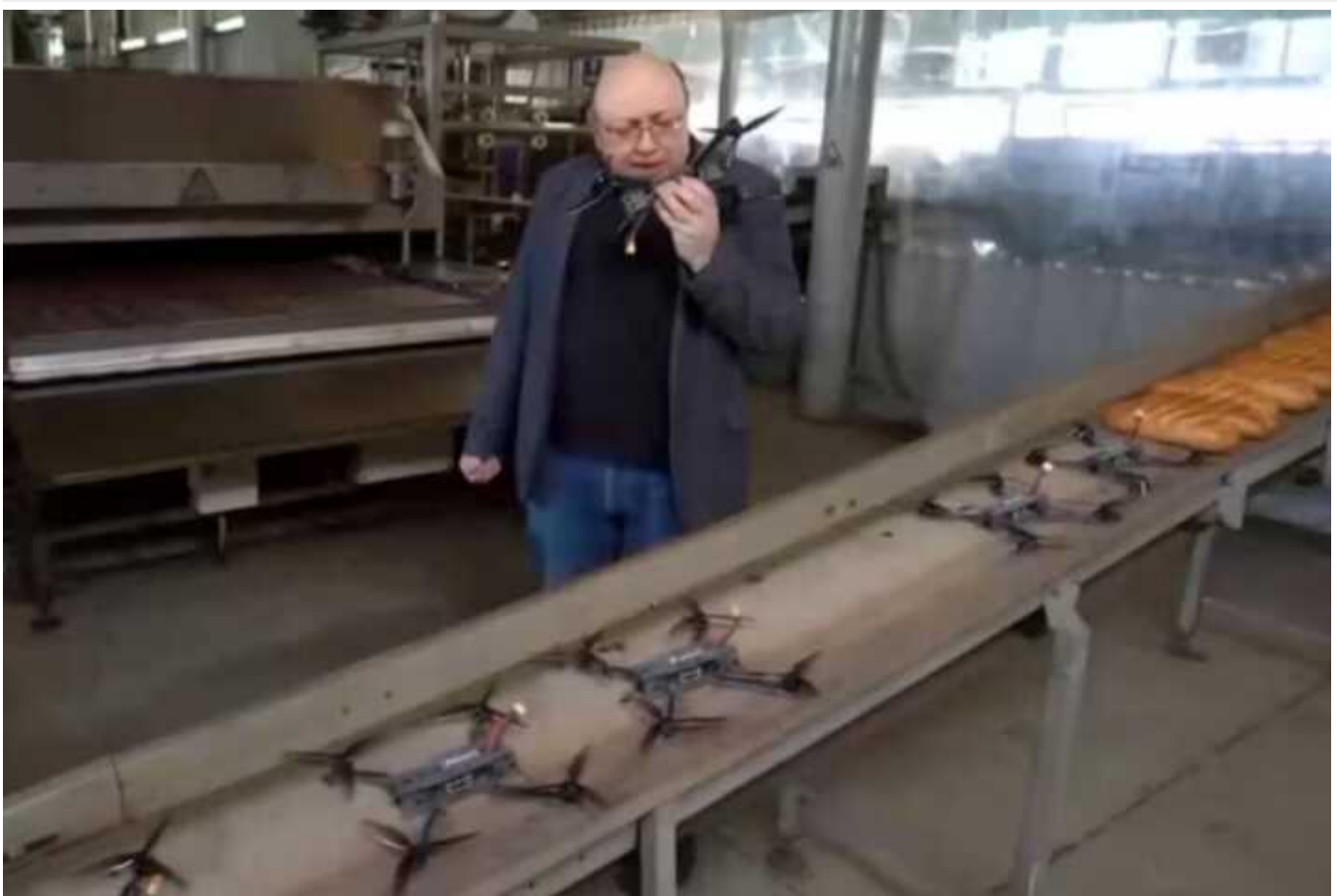
Хлібозавод у Тамбові виготовляє дрони для війни з Україною: США ввели проти нього санкції

Кремль залучає цивільні заводи до виготовлення військового спорядження та навіть зброї. До прикладу, у Тамбові хлібозавод почав виготовляти дрони на війну.