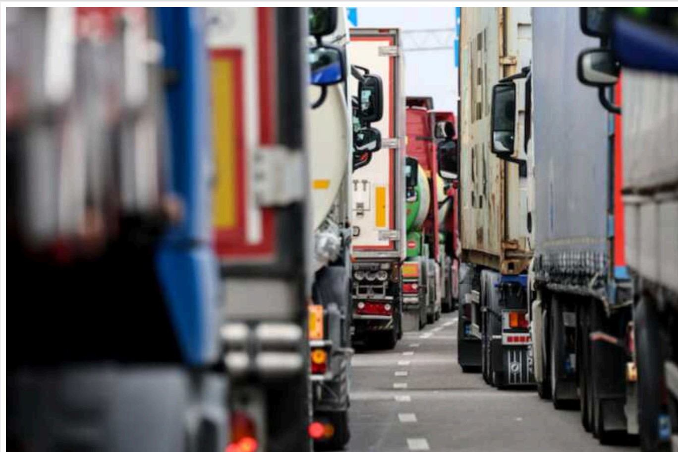
На українсько-польському кордоні у чергах стоять 2000 вантажівок

Через блокування пунктів пропуску на кордоні України та Польщі в чергах стоять 2 тисячі вантажівок.