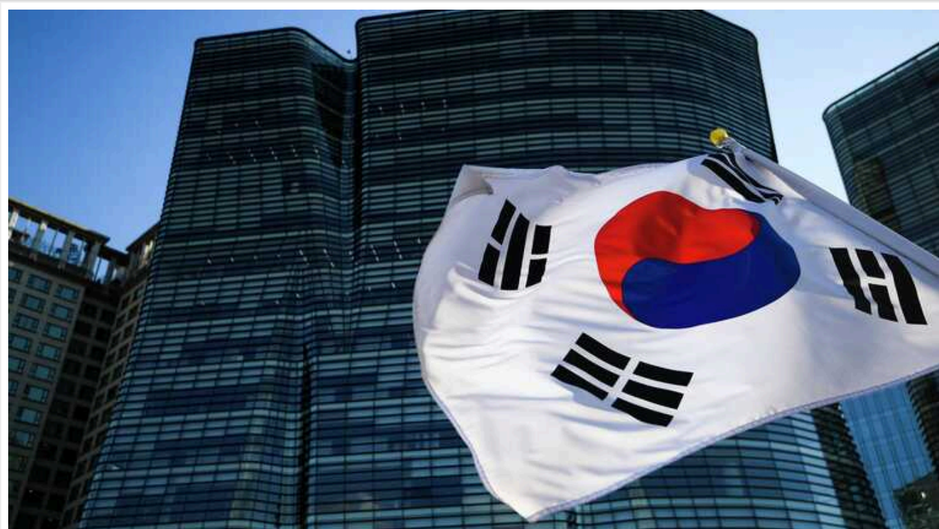
Південна Корея закликає РФ припинити угоду про зброю з Північною Кореєю

Південна Корея вчергове закликала Росію припинити будь-які операції з КНДР, що стосуються зброї, оскільки вони порушують міжнародні санкції, раніше підтримані самою ж Москвою.