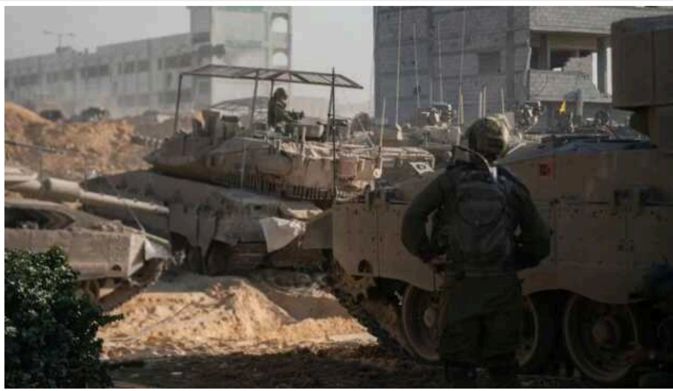
В Ізраїлі намітили плани наступного етапу війни у Газі

Міністр оборони Ізраїлю Йоав Галланта у четвер окреслив плани щодо наступного етапу війни у секторі Газі. Вони включають більш цілеспрямований підхід у північній частині анклаву та продовження переслідування лідерів ХАМАСу на півдні.