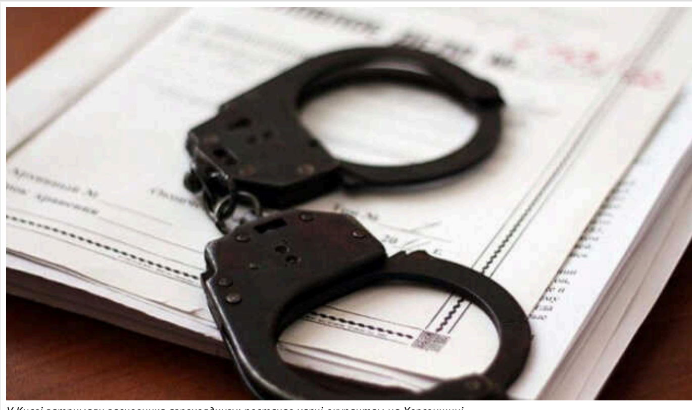
У Києві затримали засновника агрохолдингу: постачав харчі окупантам на Херсонщині

Служба безпеки України викрила засновника одного з найбільших агрохолдингів в Україні, який постачав продукти російським військовим на півдні України та надавав свої ангари для зберігання ворожого озброєння та техніки.