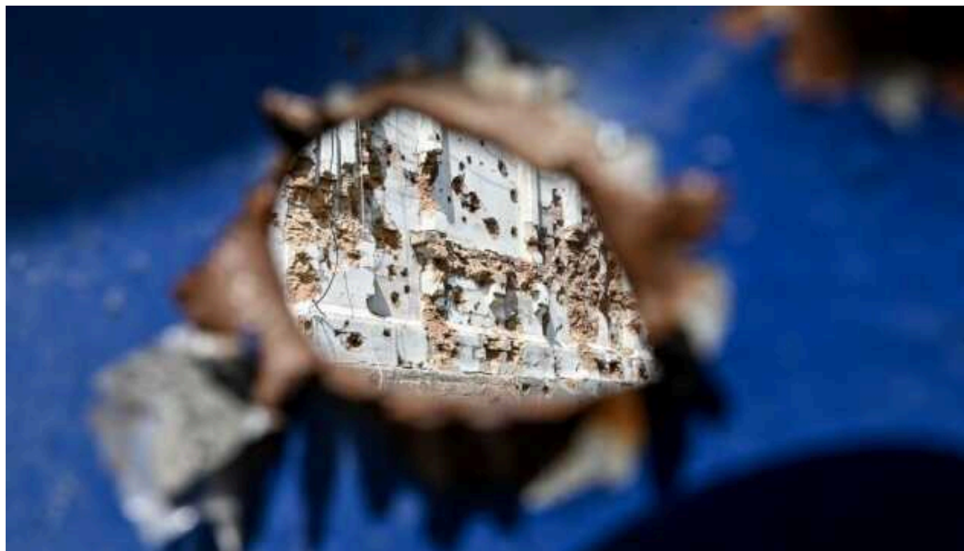
Армія загарбників за добу атакувала 11 областей України - звіт ОВА

Російські загарбники здійснили упродовж доби атаки на 11 областей України. Є загиблі і поранені.