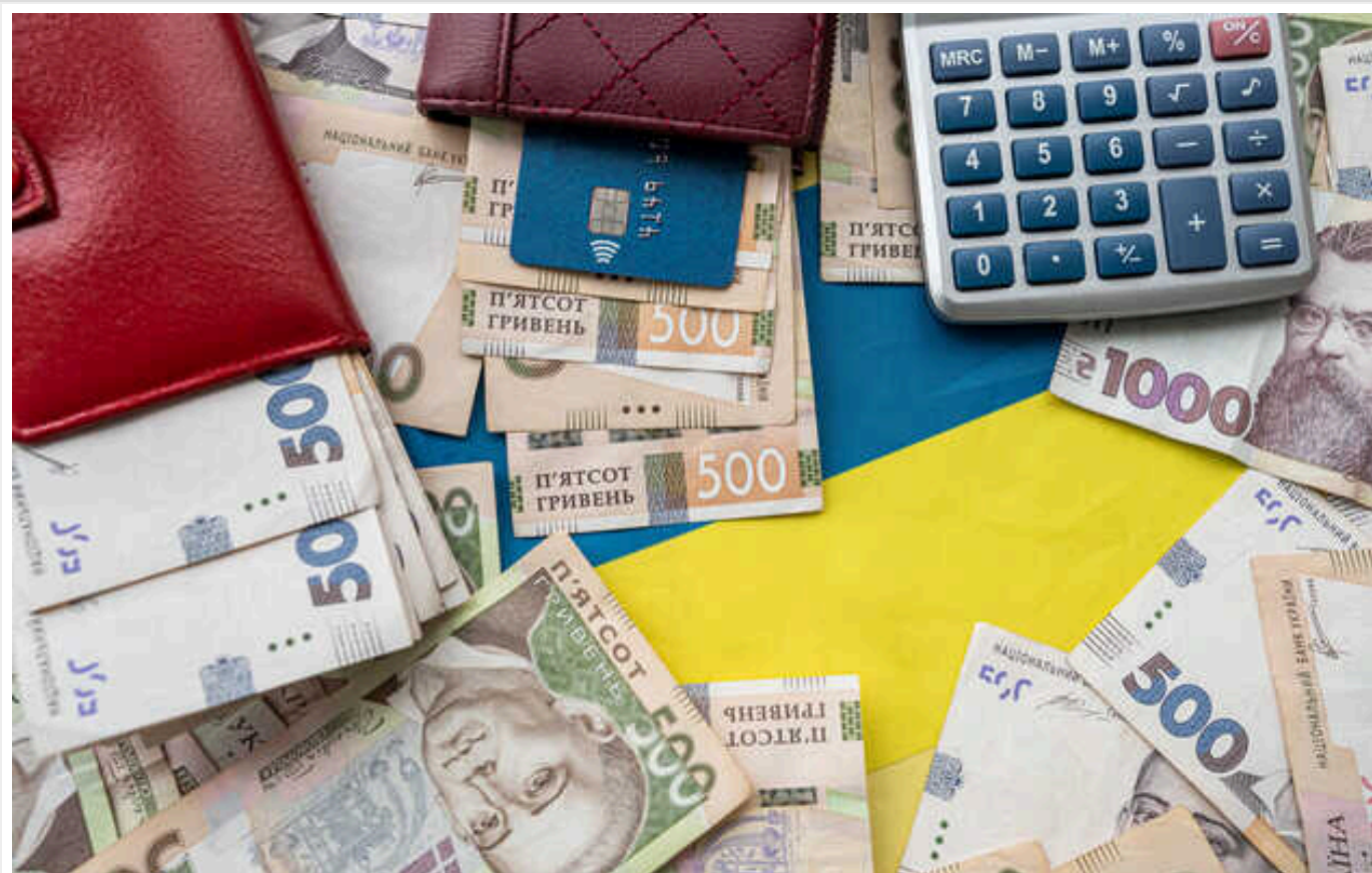
Сплата податків може стати критерієм для змін правил бронювання: ВП та уряд обговорюють цю ідею

Раніше була інформація, що бронювання від мобілізації нібито зможуть отримати: