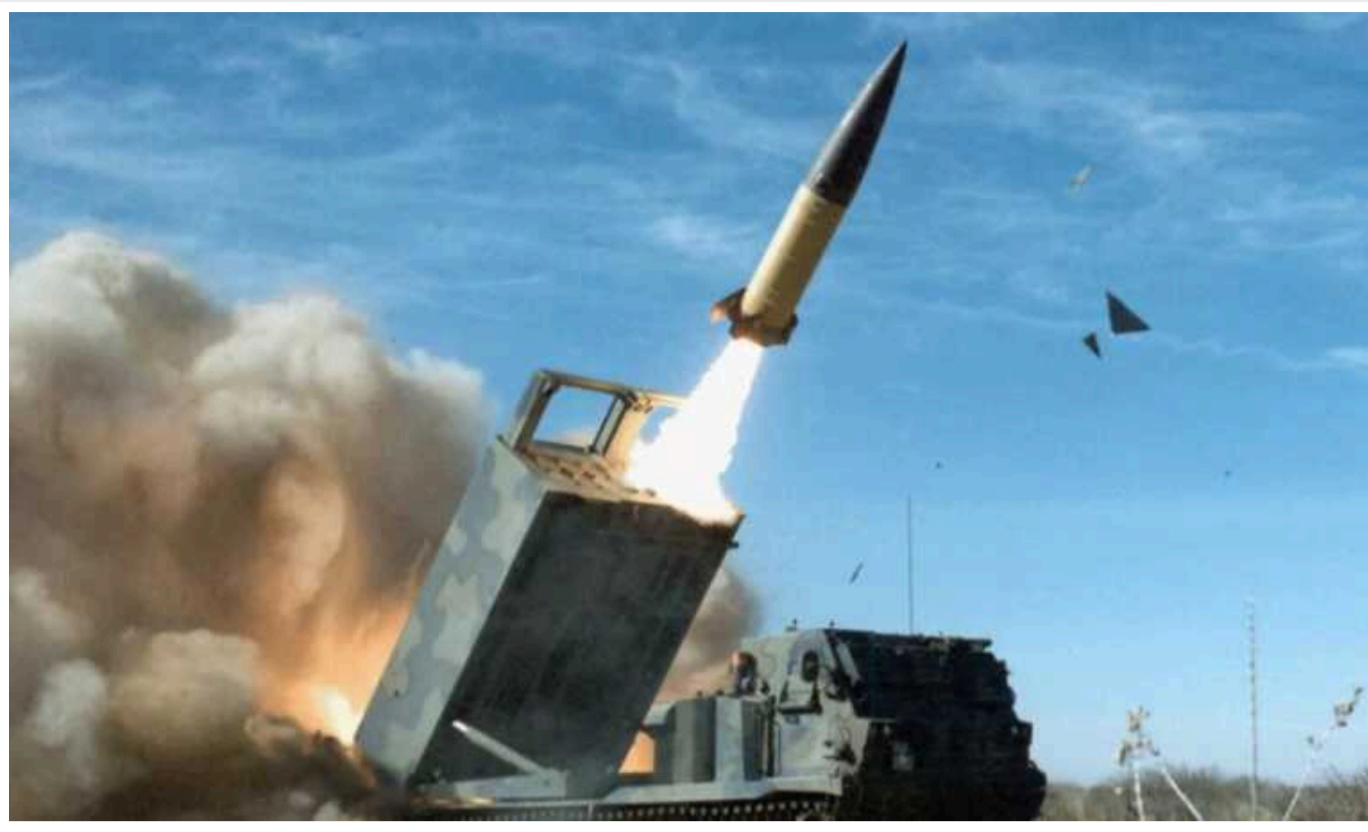
Генерал Годжес розповів, чого чекати від ЗСУ взимку 2024 року

На думку американського генерала, Росія буде намагатись переконати, що має безмежні ресурси. Тим часом Україна матиме шанс завдати шкоди ЗС РФ, якщо отримає далекобійні засоби ураження.