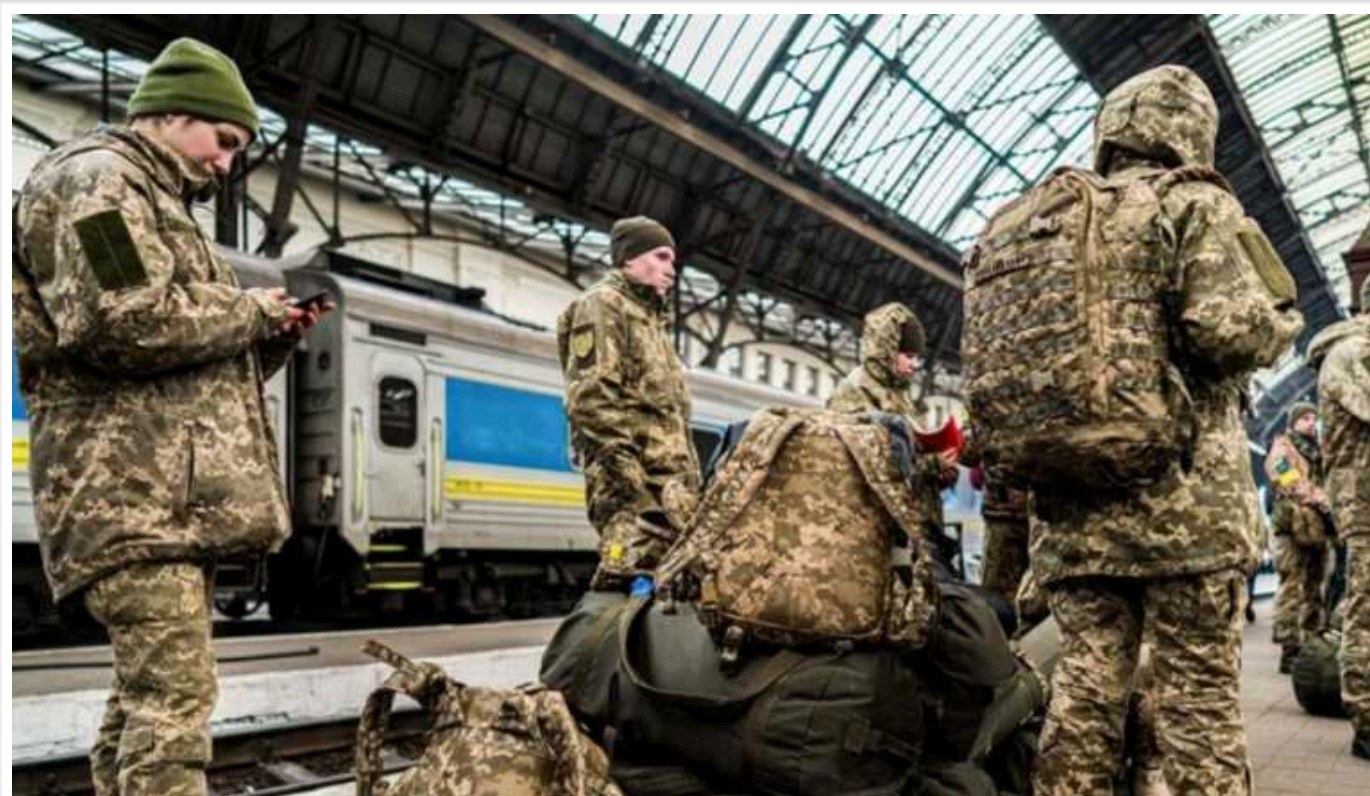
Мобілізація в Україні: адвокат пояснив, до якого віку можуть призвати в армію

Чоловіки, які досягли 60 років, не підлягають мобілізації, вони досягли граничного віку перебування в запасі ЗСУ.