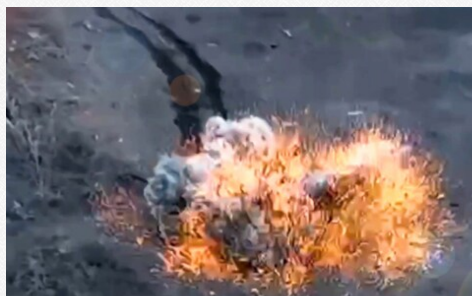
Під час боїв біля Синьківки російські війська зазнали ударів на полі бою

Друге за величиною місто України піддається майже щоденним ракетним атакам, серед цілей яких є житлові будинки та п'ятизірковий готель, які відвідують журналісти та працівники гуманітарних організацій .