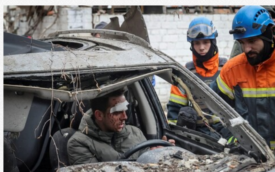
Рятувальники говорять про допомогу пораненому жителю на місці російського ракетного обстрілу в центрі Харкова

Генерал-полковник Сирський сказав, що Москва переправила більше бронетехніки та артилерії для підтримки спроб просування піхотних груп, які в основному складаються з так званих штрафних військових підрозділів «Шторм З».