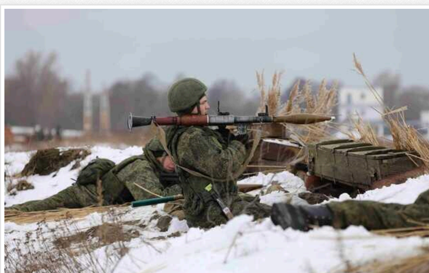
Росія може розпочати новий наступ під Харковом 15 січня, – The Telegraph

За даними джерел, російські війська готуються відновити наземний наступ на Куп'янськ та околиці.