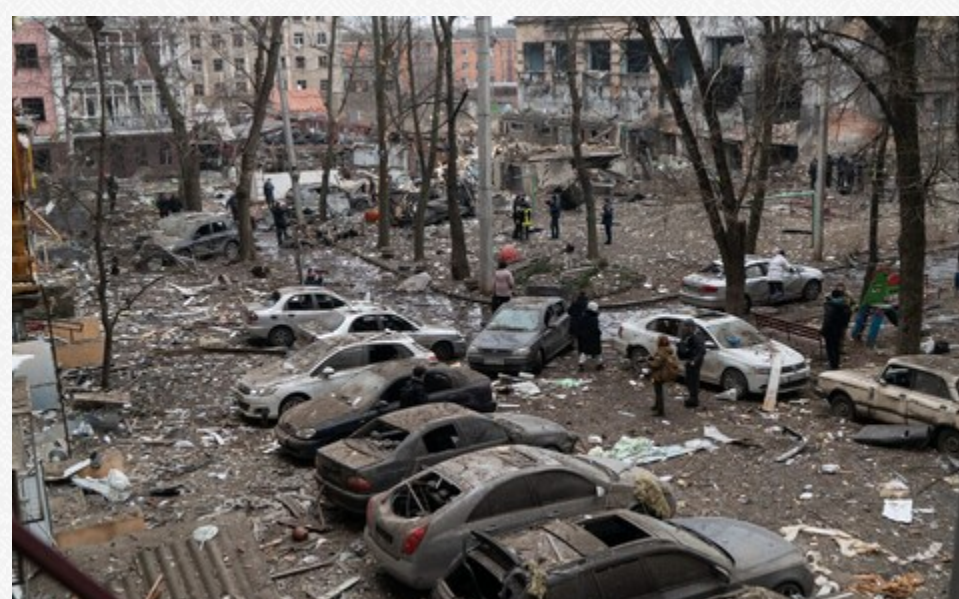
Наслідки ракетного удару по житловому будинку в Харкові

Західні аналітики кажуть, що на лінії фронту мало що змінилося, оскільки російські війська лише спорадично атакували.