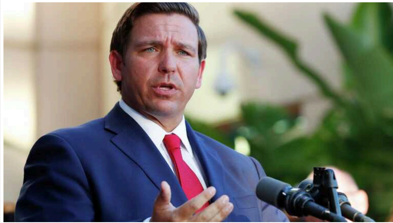
Конкурент Трампа від республіканців Десантіс піддав критиці Білий дім за політику щодо України

Республіканець Рон Десантіс розкритикував Білий дім за політику щодо України.