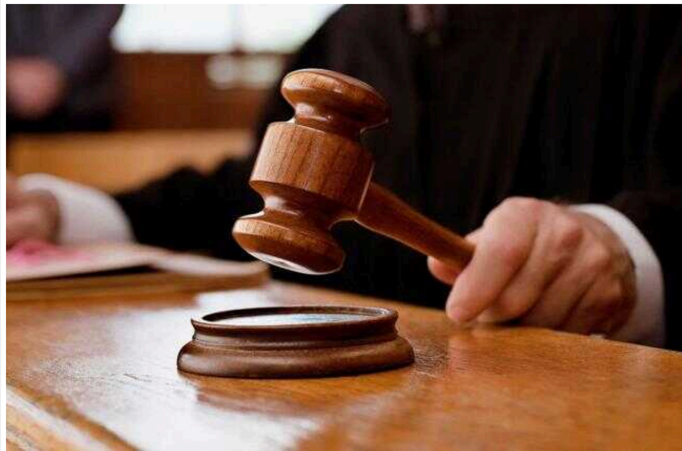
Експосадовця Запорізької ОДА виправдали від обвинувачень у корупції