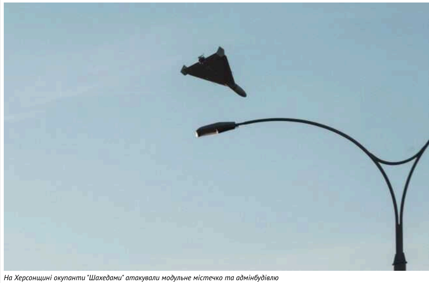
На Херсонщині окупанти "Шахедами" атакували модульне містечко та адмінбудівлю

За інформацією Херсонської ОВА, цієї ночі російська армія вдарила трьома безпілотниками типу "Шахед" по Високому Тягинській громаді.