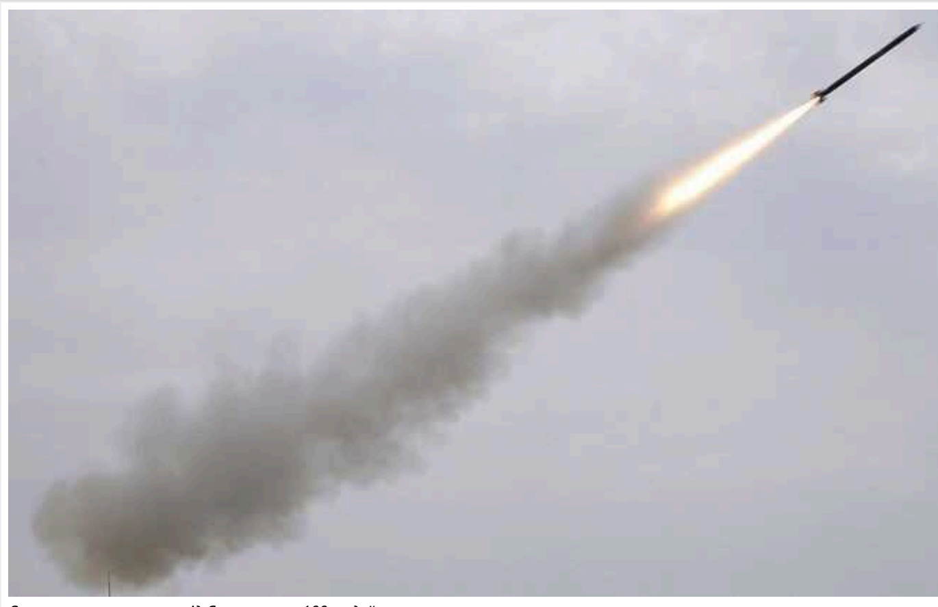
Окупанти евакуюють з-під Севастополя 100 людей через знищення ракети

У селі Чорноріччя біля Севастополя окупаційна російська влада евакуює близько 100 людей, в тому числі 15 дітей, через знищення частини ракети.