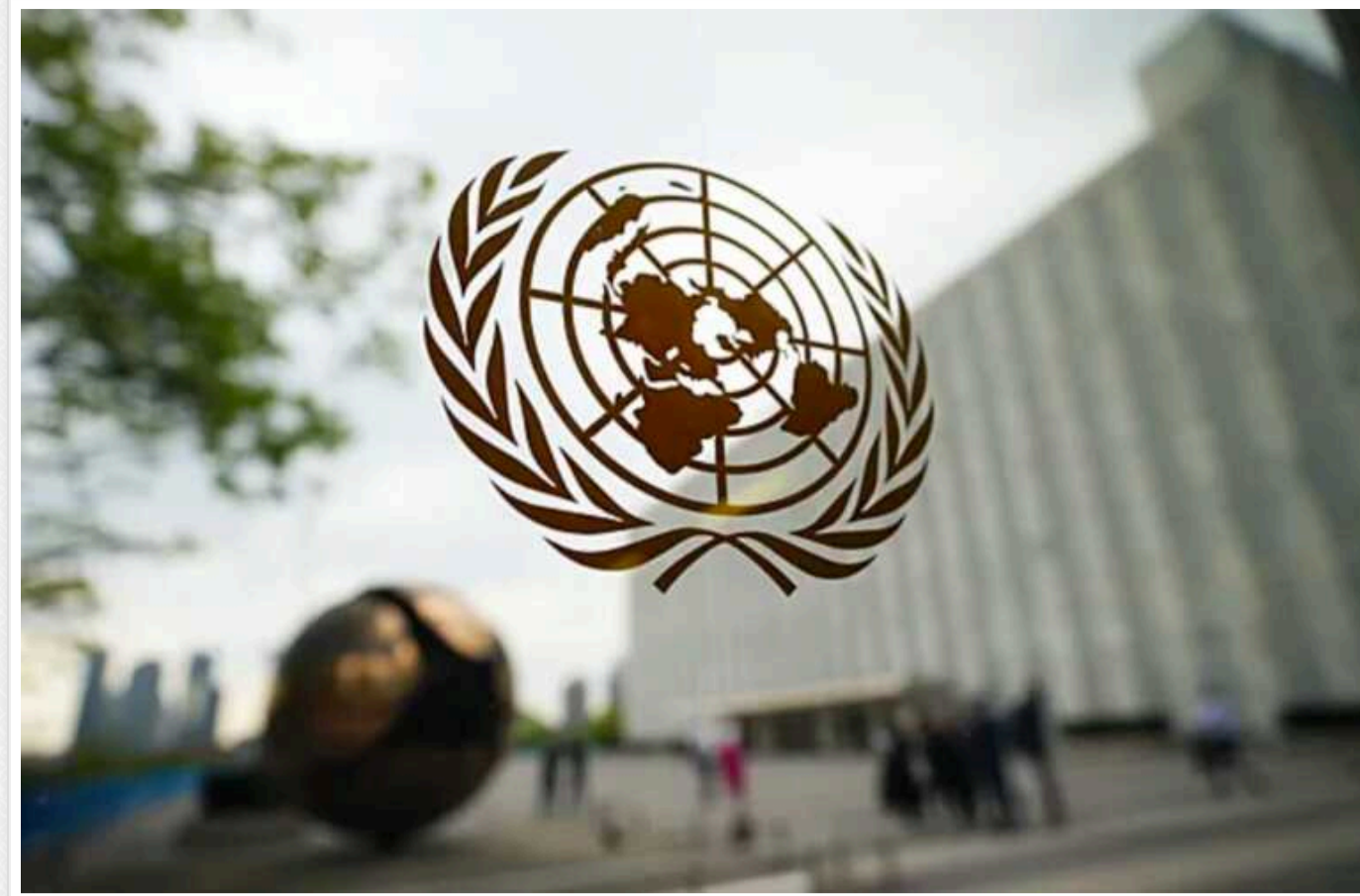
ООН прогнозує похмурі перспективи для світової економіки

Темпи зростання світової економіки сповільняться до 2,4% у 2024 році порівняно з 2,7% у 2023 році. Доповідь ООН представляє похмурі економічні прогнози на найближчу перспективу.