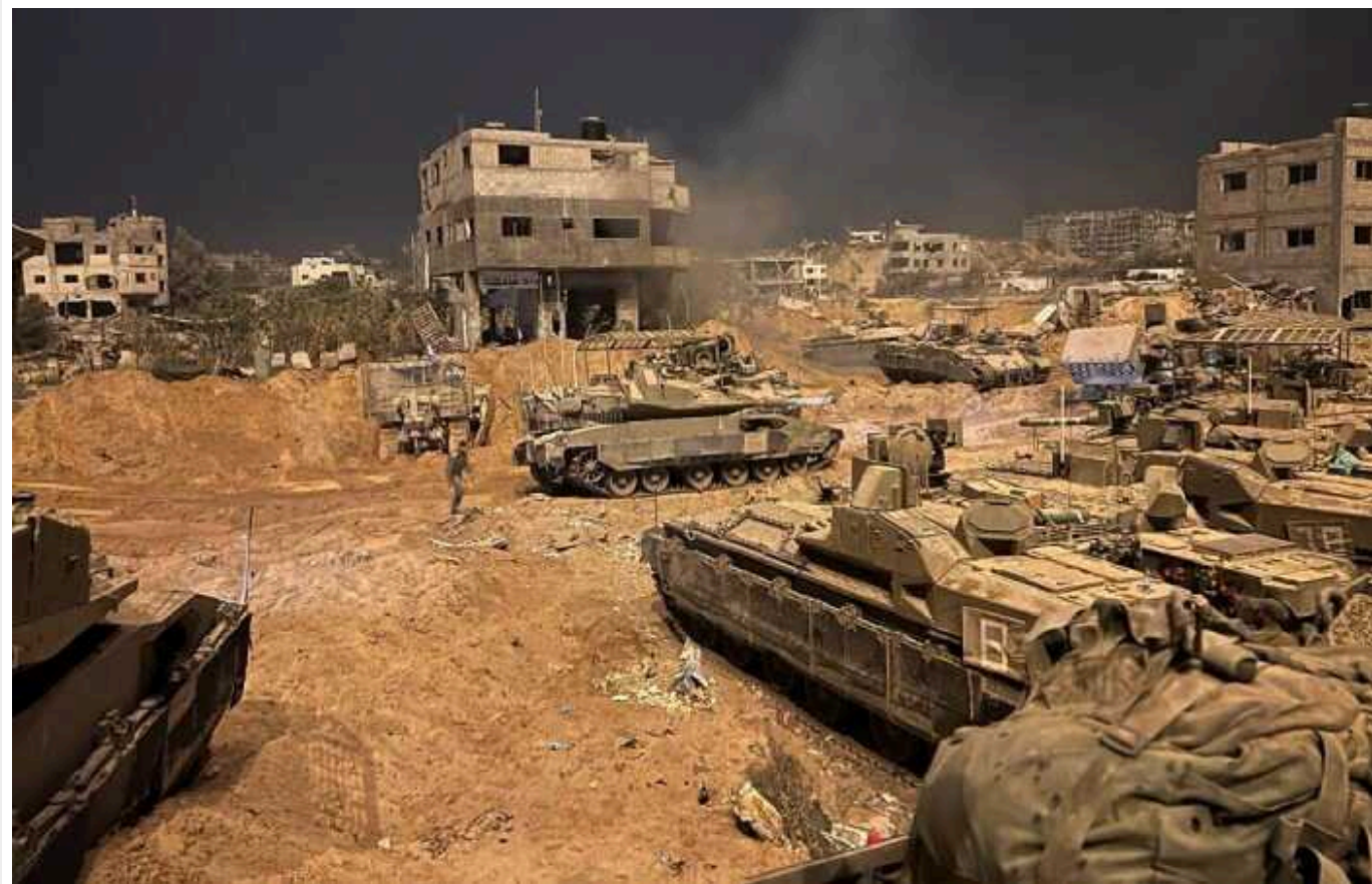
ЦАХАЛ в Секторі Гази знищив підпільний завод "ХАМАС" із виробництва зброї

У центральній частині сектора Гази на узбережжі було знайдено підземний завод "ХАМАС" із виробництва зброї. Його виявили та знищили військовослужбовці Армії оборони Ізраїлю (ЦАХАЛ).