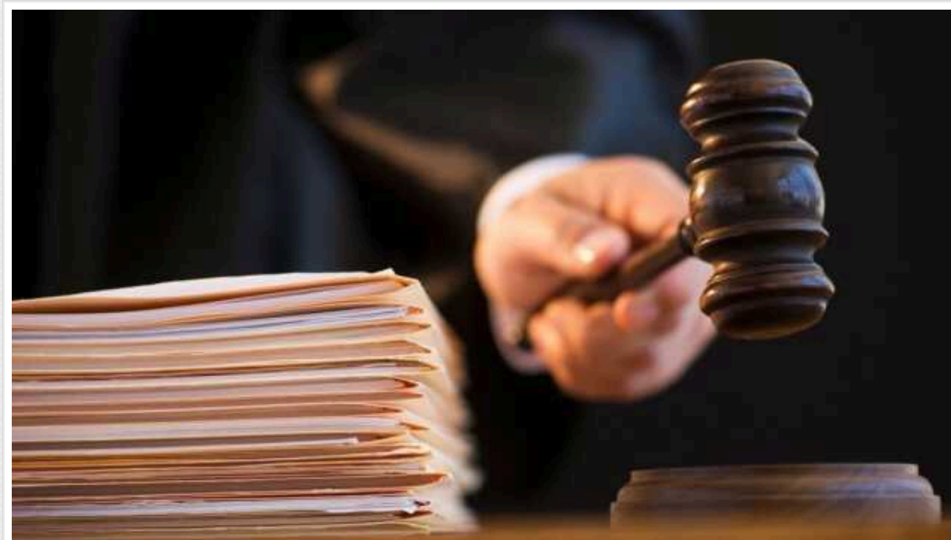
В Черкаській області до 9 років в'язниці засудили інформатора: «зливав» окупантам дані про ЗСУ

Жителя Черкас, який передавав ворогу інформацію про розташування українських військових та систем ППО, засудили до 9 років ув'язнення.