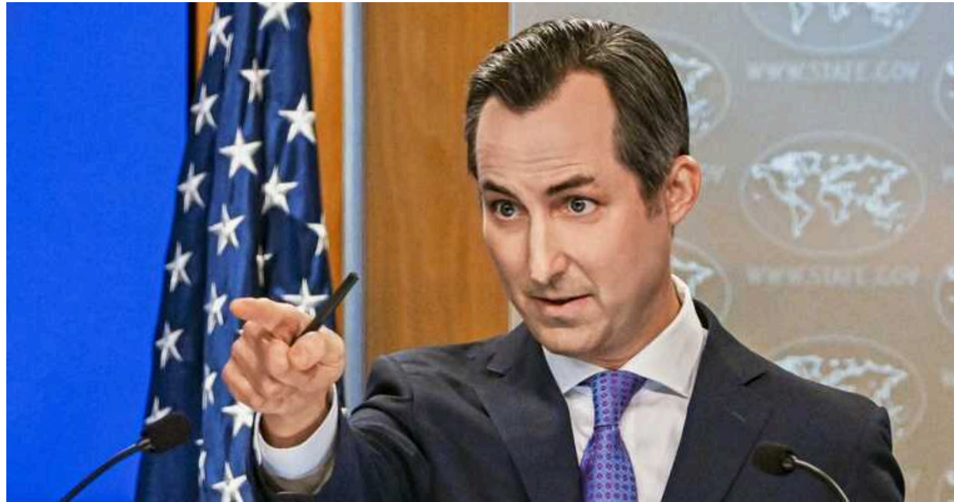
Путін не зможе досягнути своєї мети в Україні – Міллер

Конгрес має діяти, аби Сполучені Штати змогли продовжувати надавати військову допомогу Україні, заявив речник Держдепу Метью Міллер, але вже зараз цілком зрозуміло, що Росія зазнала невдачі.