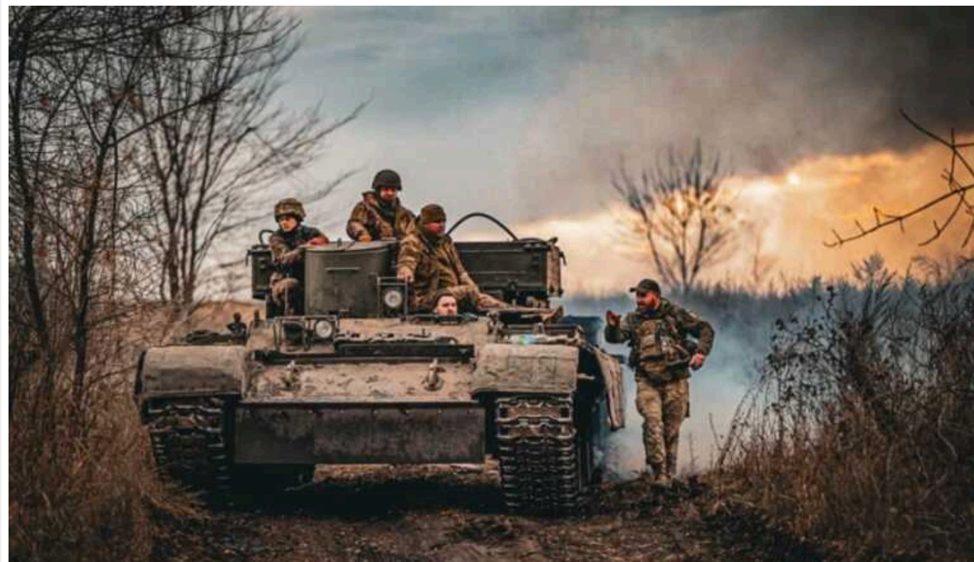
Ситуація на фронті: упродовж доби відбулося 39 боєзіткнень, відбито атаки на 5 напрямках

Розпочалася шістсот вісімдесят перша доба широкомасштабної збройної агресії Російської Федерації проти України. Противник продовжує ігнорувати закони та звичай ведення війни, використовує тактику терору, завдає ракетних та авіаційних ударів, здійснює обстріли з реактивних систем залпового вогню не лише по військових, а й по численних цивільних об'єктах нашої держави.