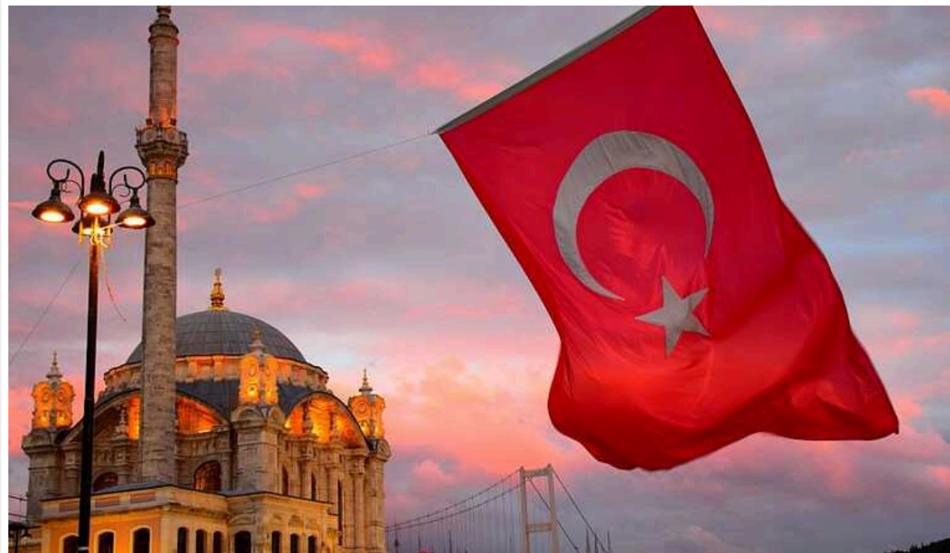
У Туреччині запропонували повернути смертну кару за вбивство жінок

Туреччині необхідно повернути смертну кару для винних у вбивстві жінок. Довічного ув'язнення за такі злочини недостатньо.