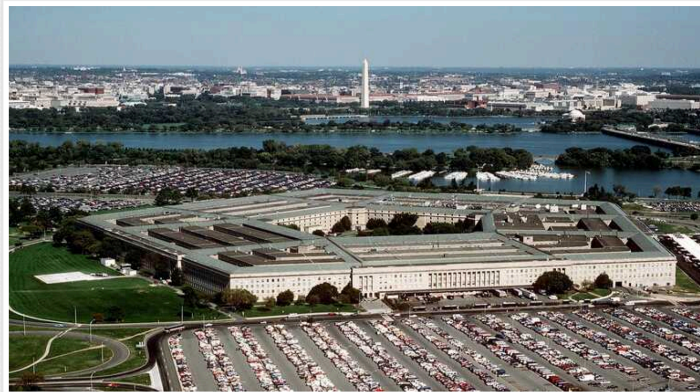
У Пентагоні спростували чутки про утилізацію ракет АТАСМС замість передачі їх Україні