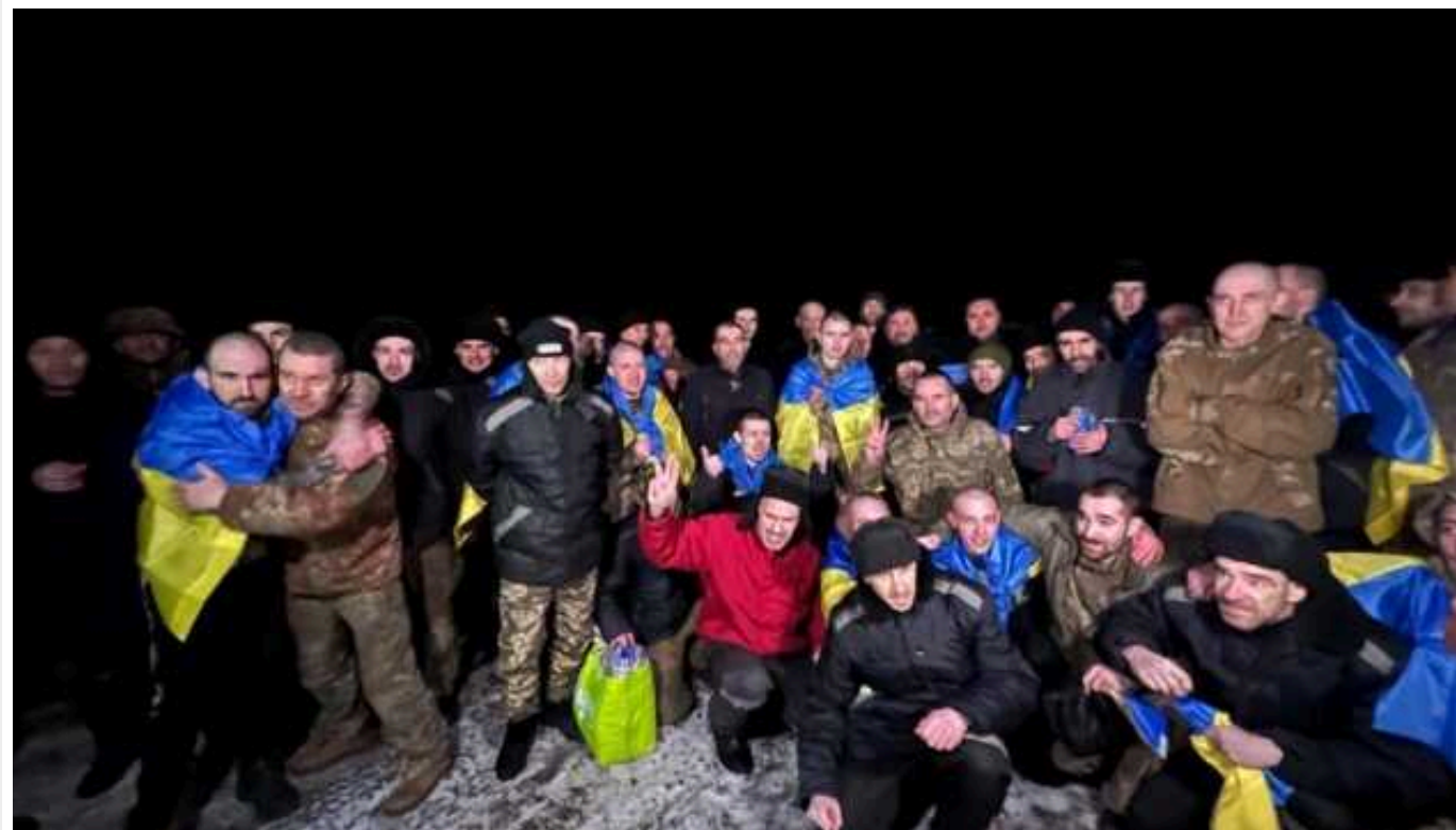
У Коордштабі роз'яснили, як проходить початкова реабілітація звільнених з полону українських воїнів

У Координаційному штабі з питань поводження з військовополоненими дали роз'яснення, як проходить початкова реабілітація цюїно звільнених з полону захисників та захисниць.