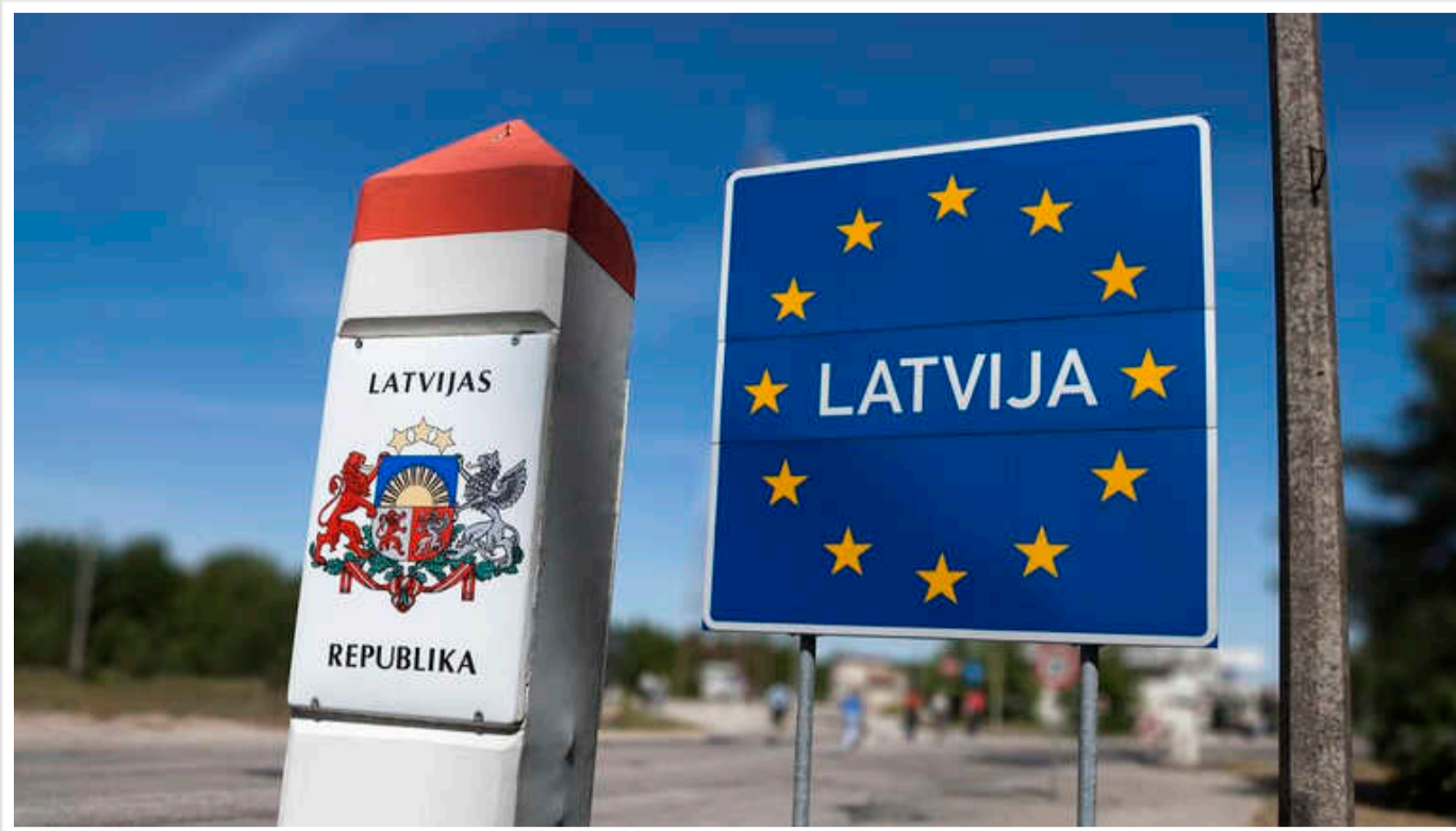
Латвія може депортувати 1167 росіян

Депортація з Латвії загрожуватиме 1167 громадянам РФ, які не виконали вимог поправок до закону про імміграцію та не надали документи для отримання посвідки на проживання в країні, згідно з інформацією з латвійської Дирекції у справах громадянства та міграції (PMLP).