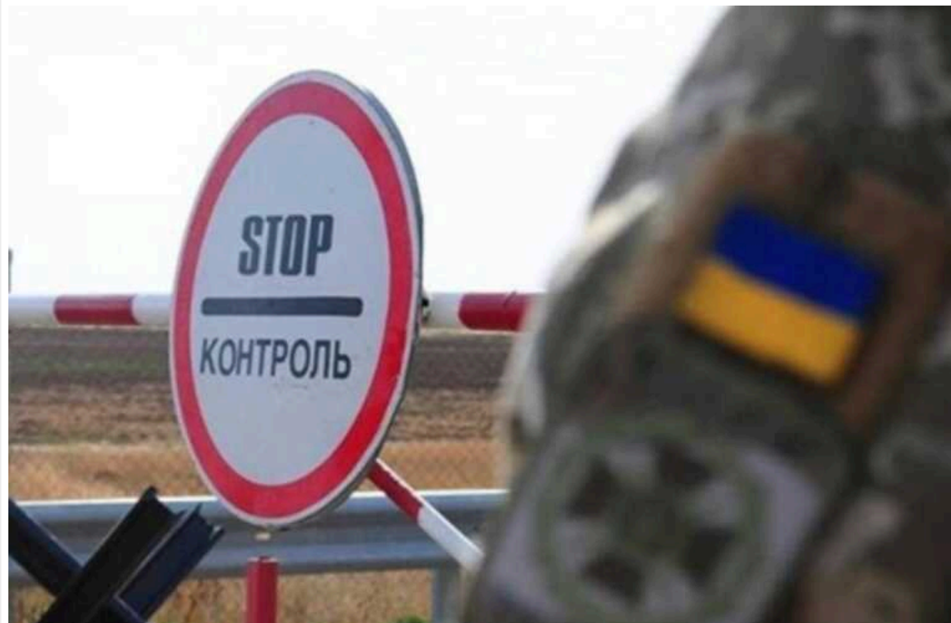
Мобілізація в Україні: чи дозволено виїзд чоловікам, знятим з військового обліку або багатодітним

Прикордонники виявили 3 тисячі фальшивих довідок, які використовували українці для виїзду за кордон. Тому тепер почали вимагати підтвердження статусу у військово-облікових документах.