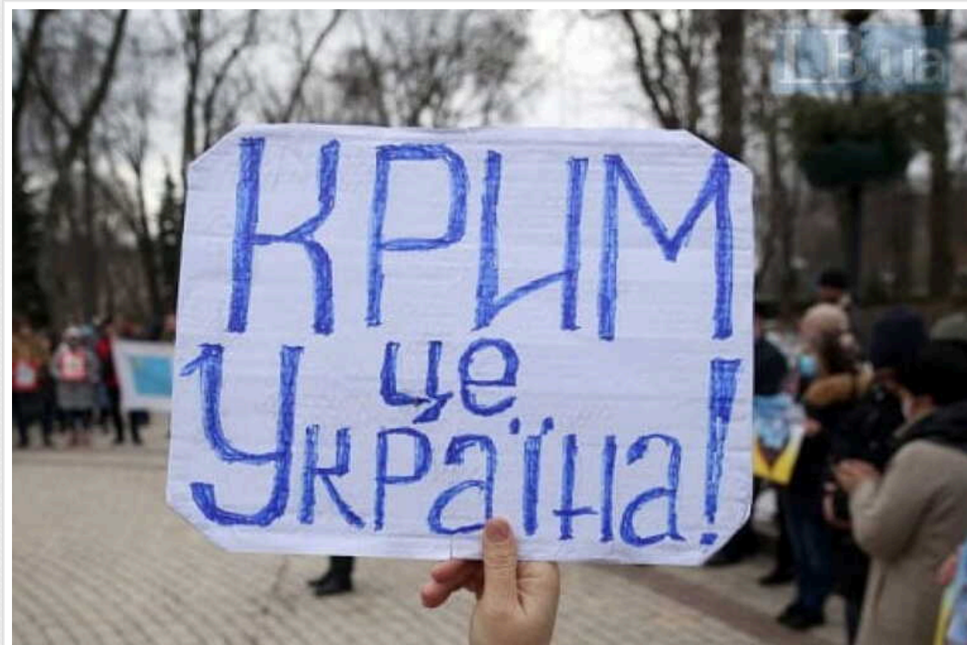
Генерал відповів, чи зможе Україна звільнити Крим: "Буде складно"

Ракети великої дальності можуть нейтралізувати авіабазу в Саках та логістичну базу в Джанкої. Їх використання зробить Крим непридатним для російських військ та створить можливості для подальших дій, таких як запровадження спецназівців у регіон. Про це повідомив экс-командувач військ США в Європі генерал-лейтенант у відставці Бен Годжес в ефірі телемарафону.