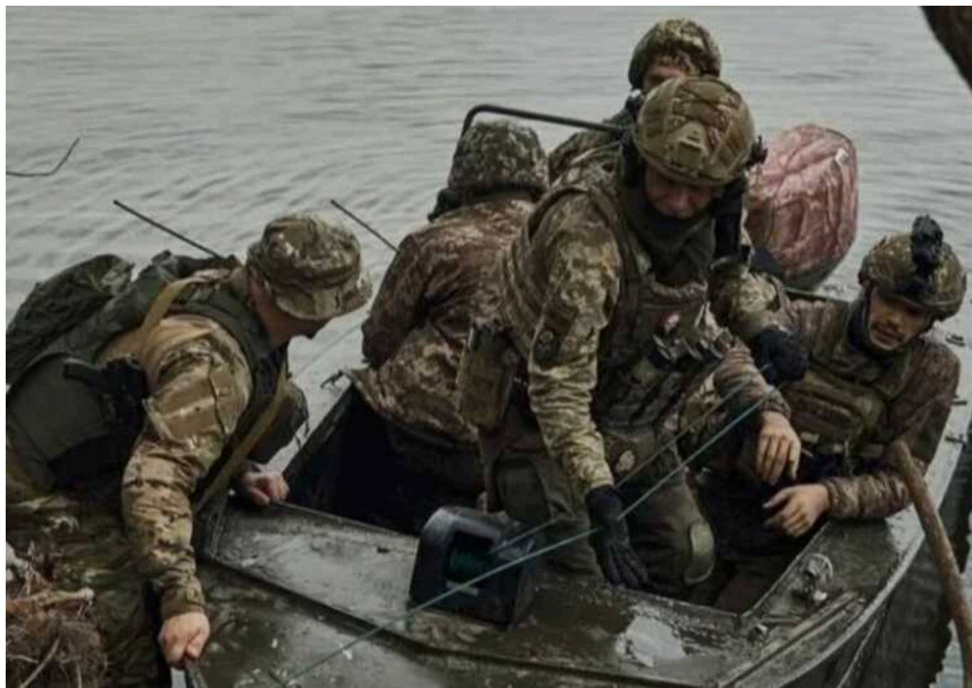
Українські морпіхи розповіли WP про деталі та смертельні ризики операцій за плацдарм біля Кринок

Кожна операція українських морських піхотинців, які форсували Дніпро, щоб захопити й утримати плацдарм в районі села Кринки на лівобережжі Херсонщини, є надважкою, виснажливою та ризикованою.