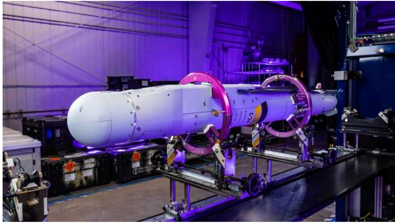
Сполучені штати створють "розумні" бомби StormBreaker

Радар та інфрачервоне наведення крилатого StormBreaker може наводити ракету на рухомі цілі в темряві, під час дощу, туману, в диму або пилу.