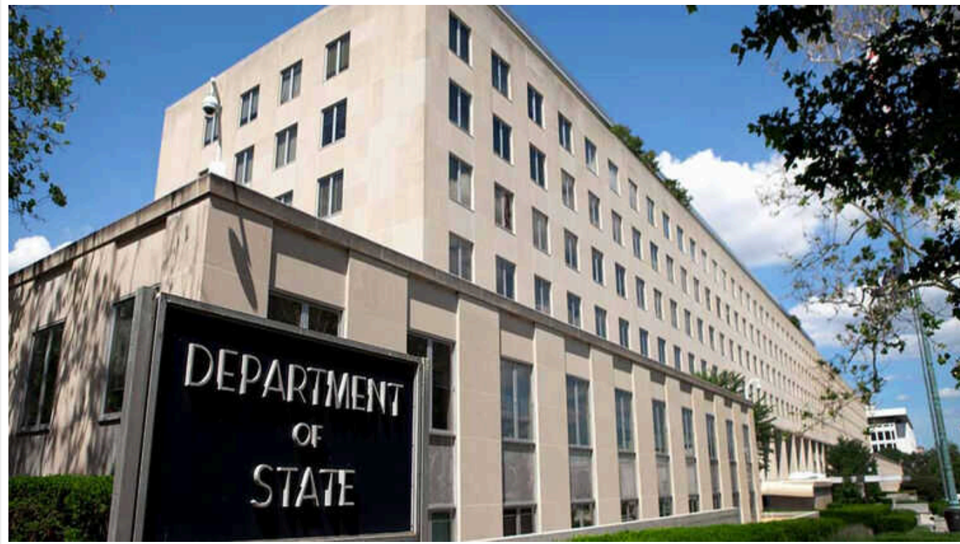
Сполучені штати пообіцяли підтримувати Україну, але не обов'язково на рівні 2022 і 2023 років

США підтримуватимуть Україну скільки потрібно, але вже не обов'язково на рівні 2022 та 2023 років.