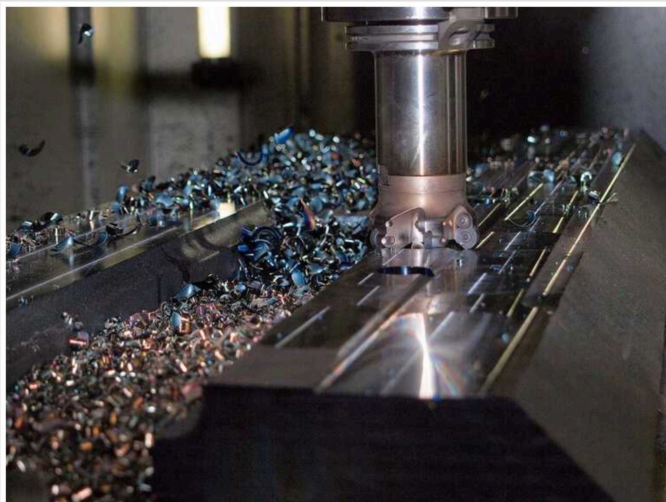
Експорт станків з Китаю до Росії збільшився в 10 разів із початку війни в Україні, - FT

Йдеться про фрезерувальні верстати з ЧПУ на суму 68 мільйонів доларів порівняно з 6,5 мільйонами доларів у лютому 2022 року. Повідомляє The Financial Times.