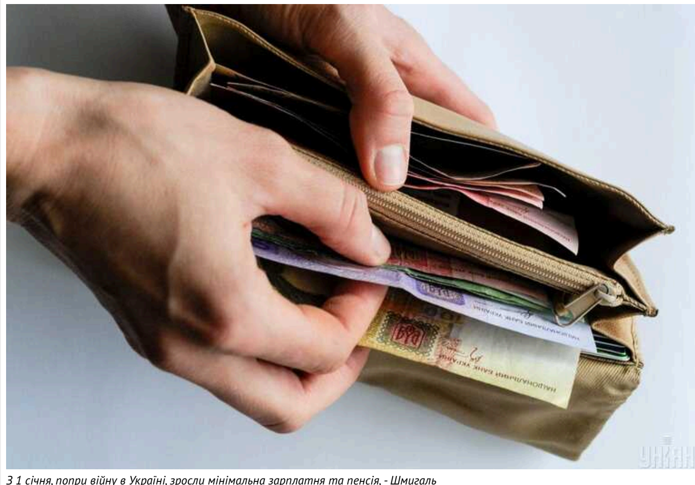
3 1 січня, попри війну в Україні, зросли мінімальна зарплатня та пенсія, - Шмигаль

3 1 січня в Україні зросла мінімальна зарплата на 6%: з 6700 грн до 7100 грн. Ще одне її підвищення заплановане на весну. Крім того, збільшився прожитковий мінімум до 2920 грн та пенсія.