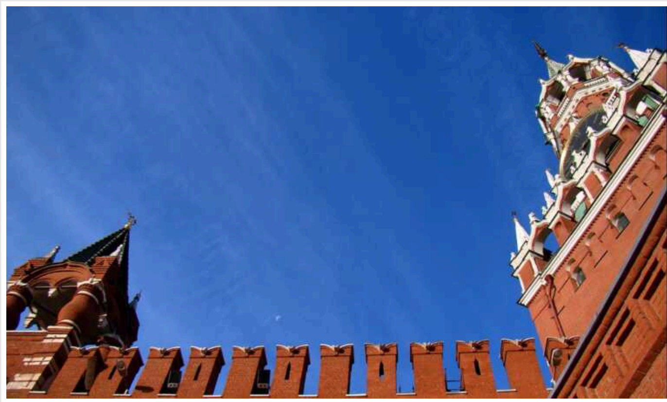
Розвідка Британії розповіла, що стоїть за створенням спецслужби охорони в Москві з подачі Кремля

Сили безпеки уряду Москви (СБУМ), служба охорони столиці РФ, створення якої президент Володимир Путін схвалив у листопаді 2022 року, є одним із прикладів давньої російської традиції "парамілітаризації". Проєкт дозволяє москвичам добровільно виконувати патріотичні обов'язки, уникаючи служби на передовій в Україні.