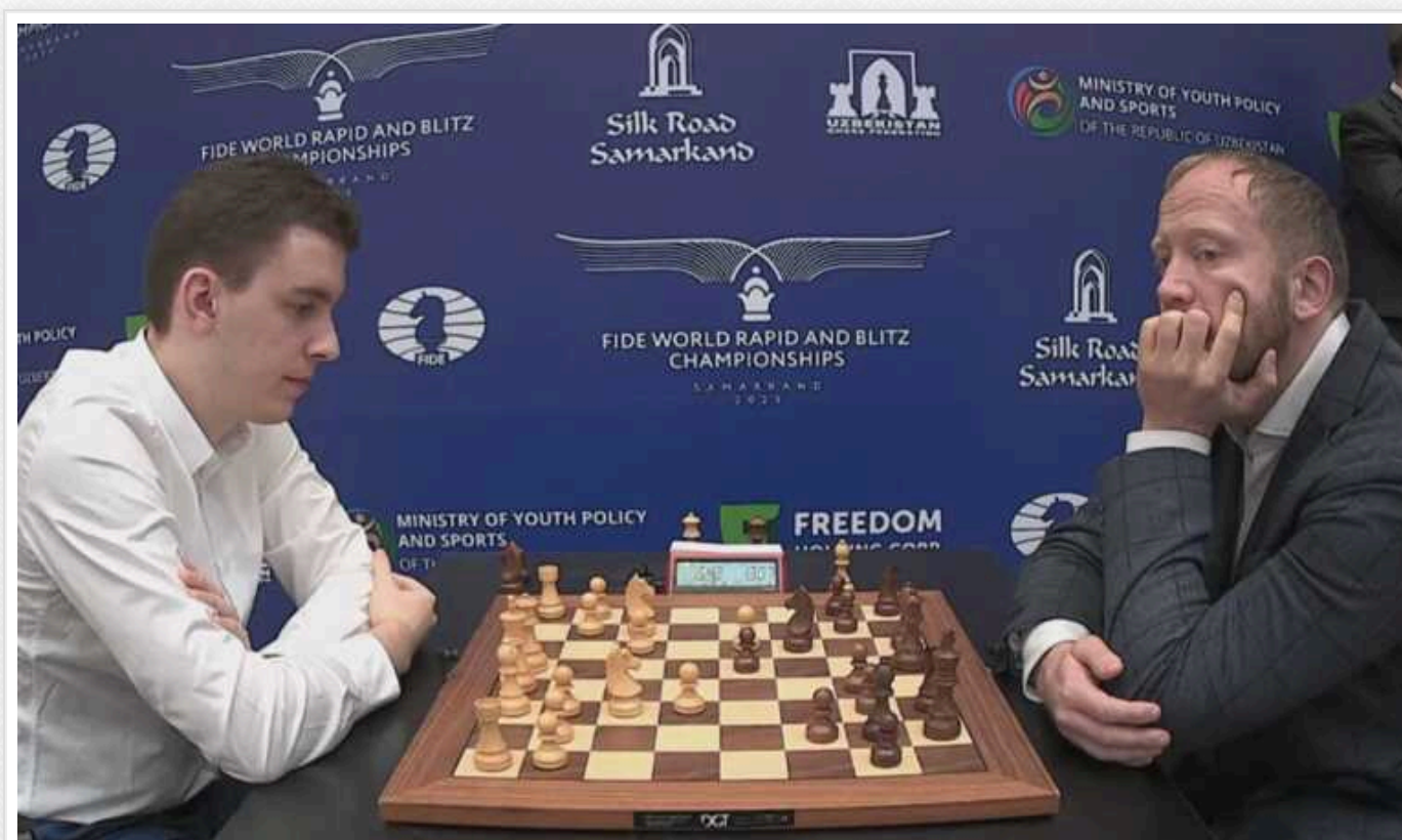
В Росії видали брехню про відмову польського шахіста тиснути руку росіянину