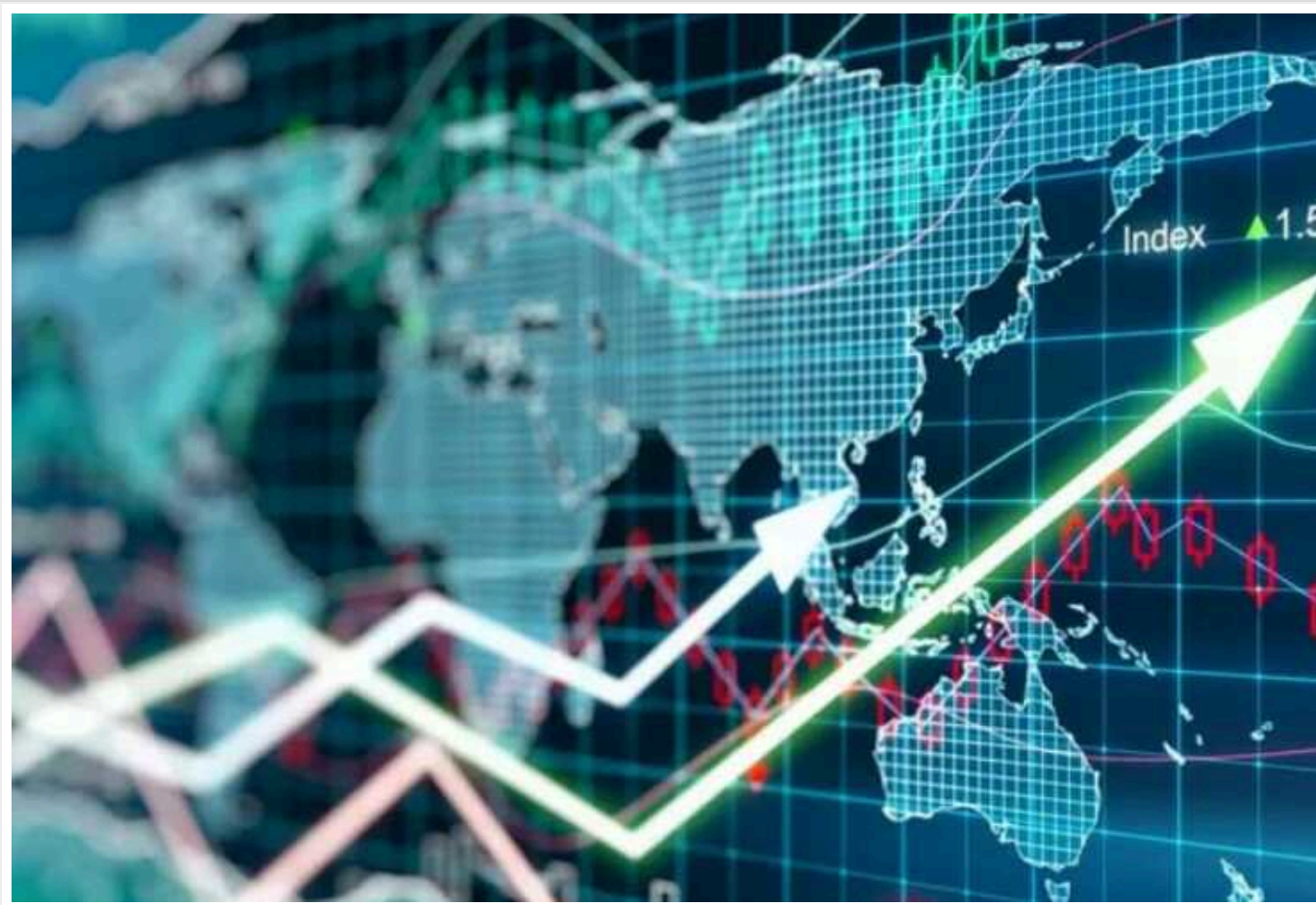
The Economist назвав низку країн, які отримають економічні "суперсили" до 2050 року

До 2050 року можуть відбутися зміни серед країн-лідерів глобальної економіки. Отримати економічні "суперсили" до цього часу планують Індія, Індонезія та Саудівська Аравія. Крім того, власні схеми проривного зростання підготували й невеликі країни, включно з Камбоджею та Кенією.