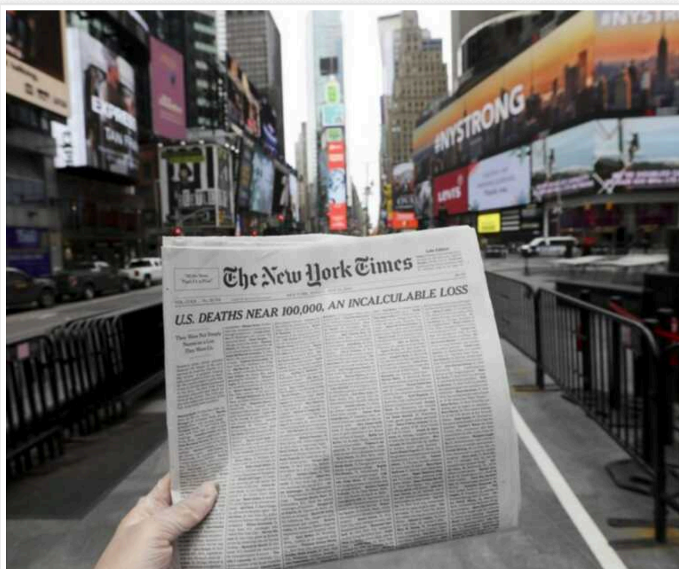
Видання NYT захейтили в мережі за позицію щодо України та нагадали про злочини Кремля

У мережі здійнялася хвиля хейту на адресу американського видання The New York Times . Користувачі обурили стаття про втому від війни та недовіру до національного телемарафону, який звинуватили у зображенні нібито занадто "рожевої картини" війни.