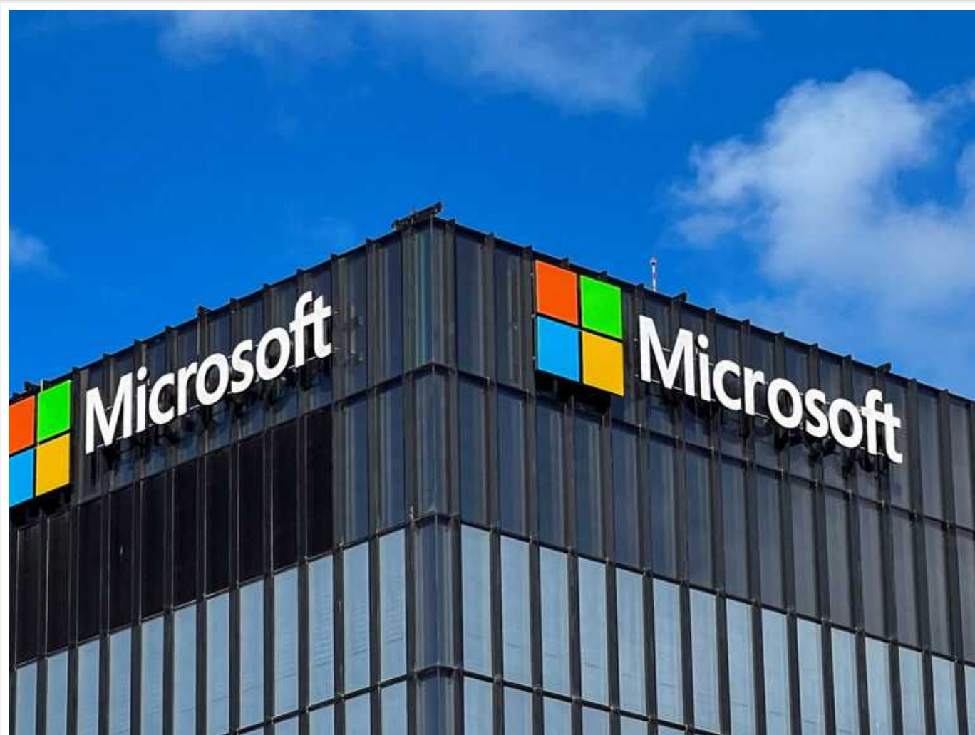
Microsoft змінить клавіатуру, уперше за 30 років: що з'явиться на місці кнопки Windows

Багатонаціональна компанія Microsoft уперше за 30 років внесе зміни у клавіатуру ПК. Замість клавіші Windows там з'явиться кнопка для запуску ШІ-помічника Copilot власної розробки.