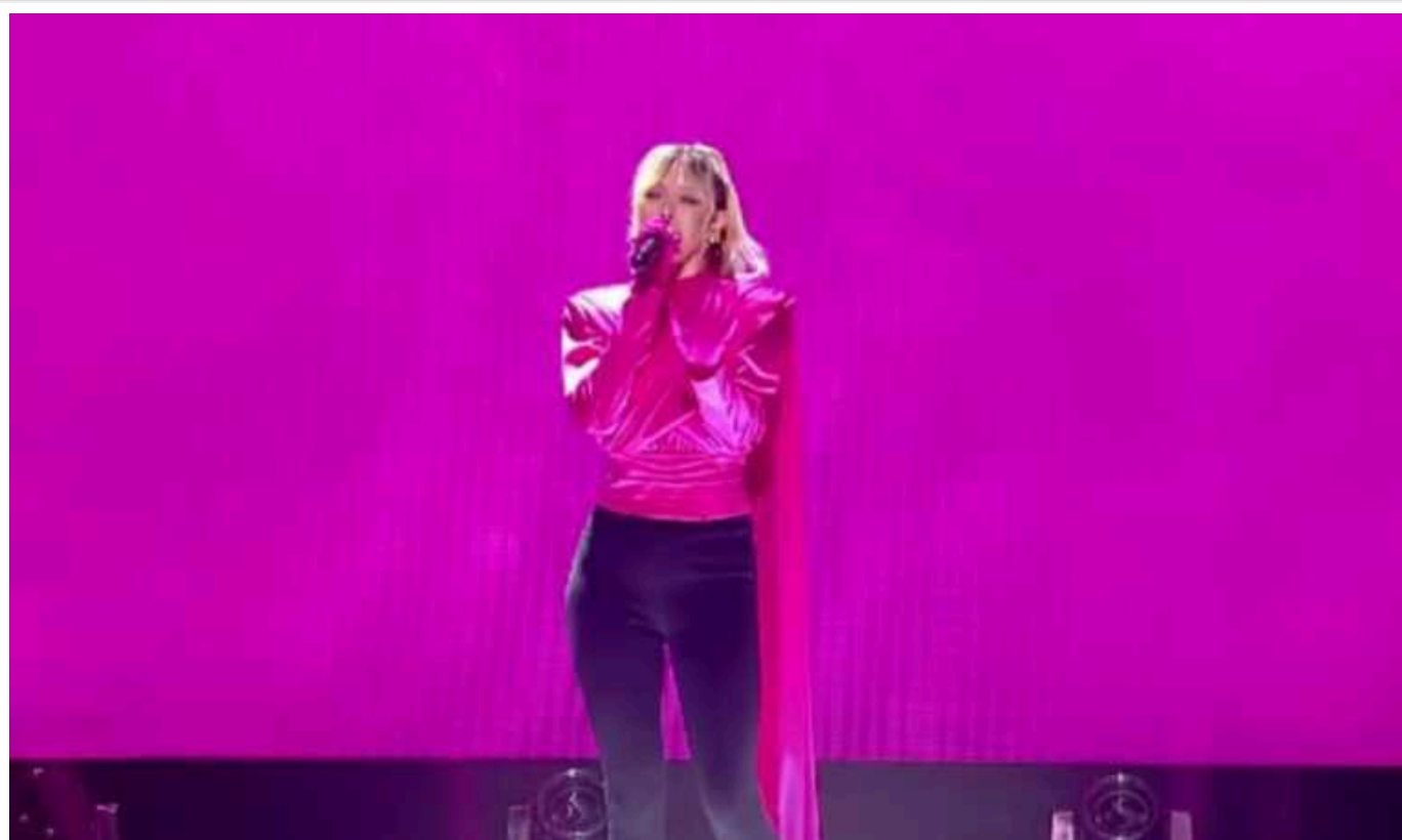
Виступ Віри Брежнєвої з музичного новорічного концерту на "1+1 Україна" вирізали з ефіру

Канал "1+1 Україна" вирівав зі свого ефіру виступ ексспівачки Віри Брежнєвої, а нині виконавиці VERA, у новорічному концерті "Музична платформа".