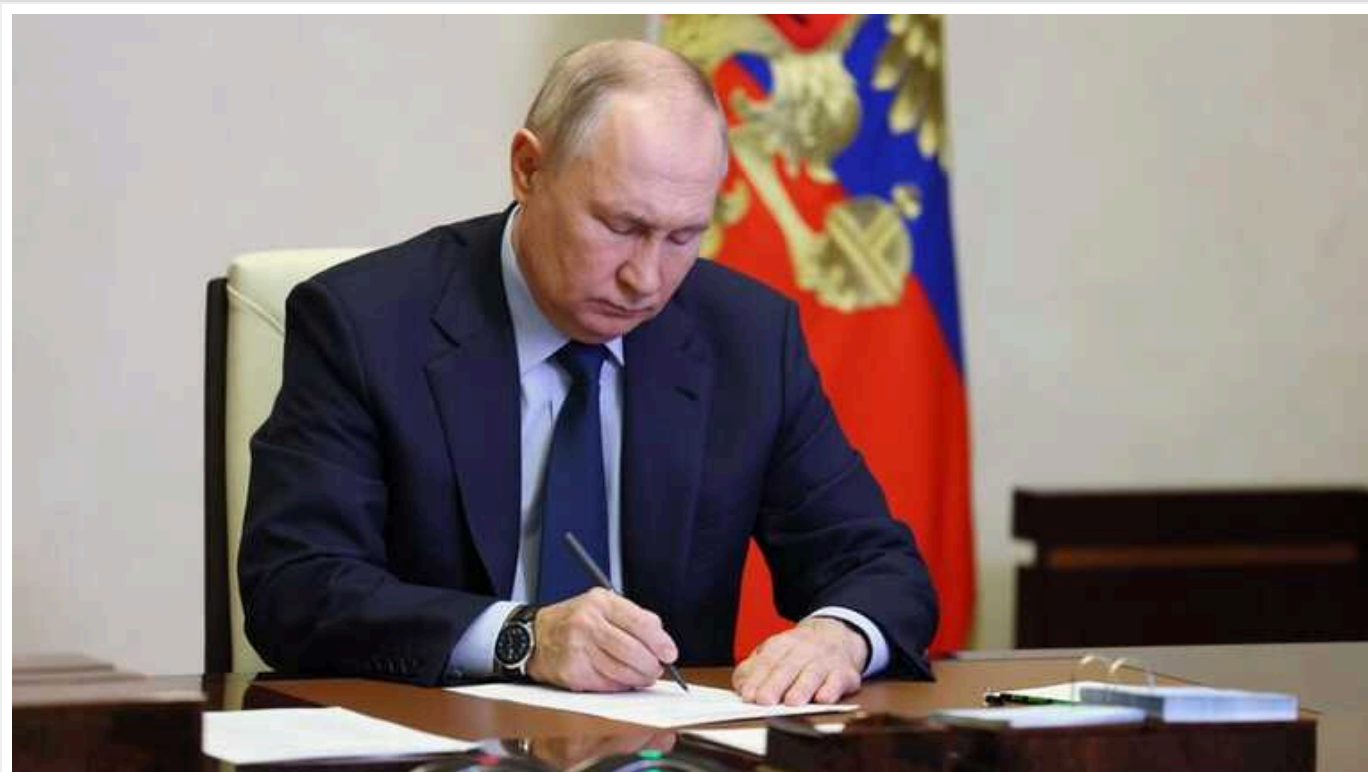
Путін бажає проводити переговори не з Україною, а з Заходом, - ISW

Так вони розцінили останню заяву Путіна, в якій він наголосив, що "сама Україна для нас не ворог".