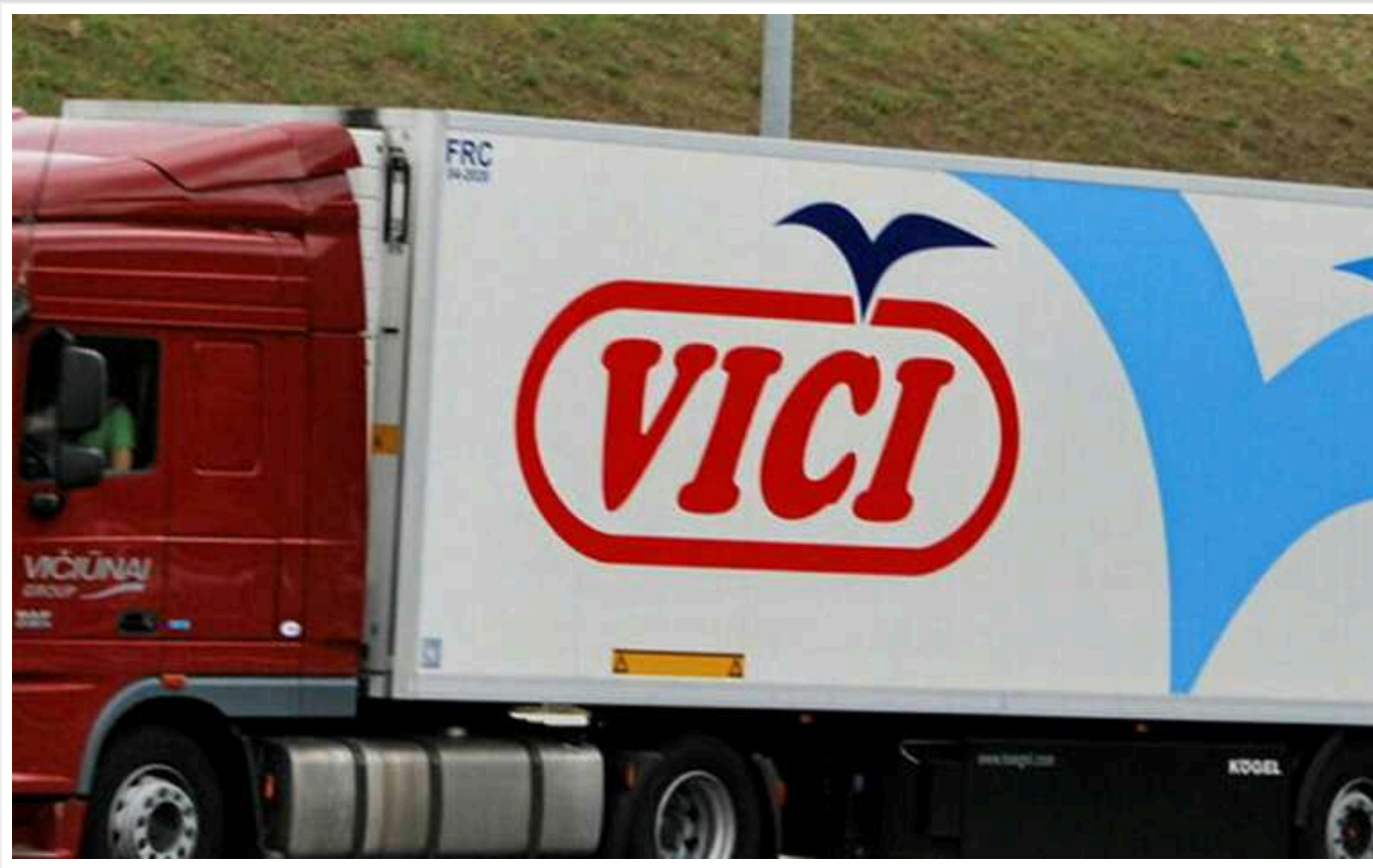
НАЗК внесла до списку спонсорів війни компанію Viciunai Group

Національне агентство з питань запобігання корупції внесло до переліку міжнародних спонсорів війни литовську компанію Viciunai Group. Незважаючи на обіцянки піти з російського ринку компанія і надалі сплачує податки до бюджету Росії.