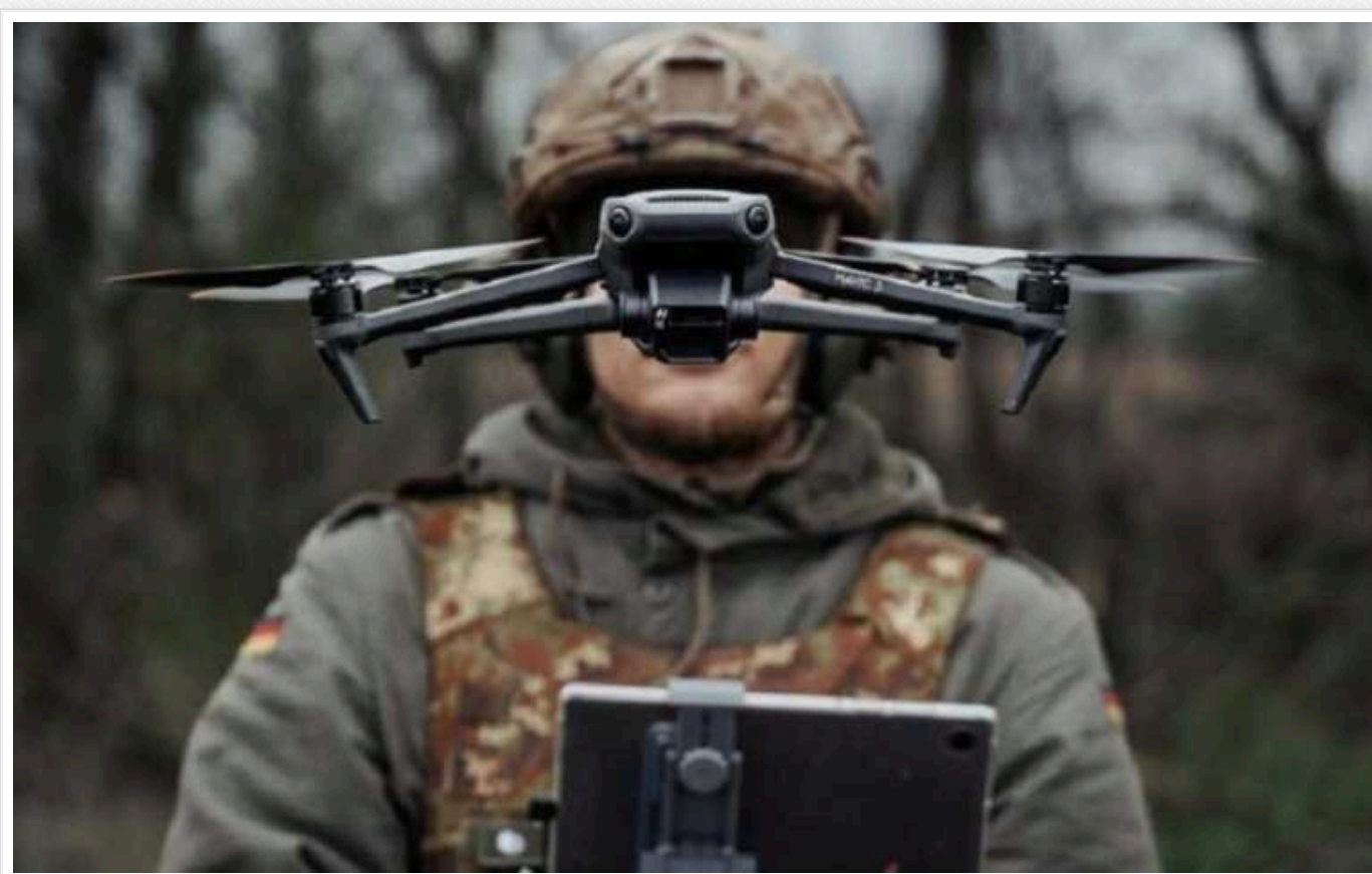
У "Дії" розповіли, як українці можуть збирати дрони власноруч

На платформі можна дізнатися чіткий алгоритм дій та як самостійно створити БПЛА, або стати постачальником запчастин чи задонатити на дрони.