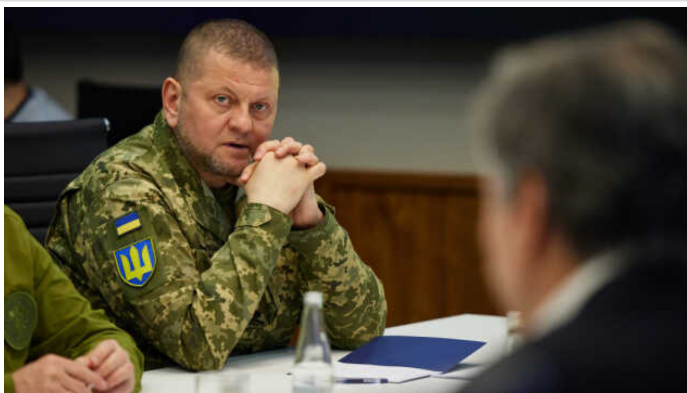
"Ким мені воювати": Залужний заявив про важку ситуацію з особовим складом у ЗСУ під час обговорення закону про мобілізацію

NV дізнався, про що йшлося на першому обговоренні законопроекту про мобілізацію на засіданні комітету з нацбезпеки Верховної Ради України.