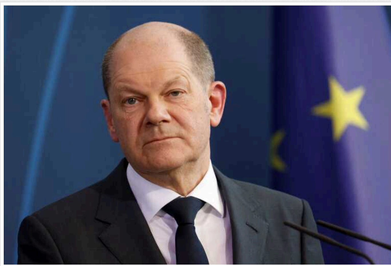
У постраждалому від повені регіоні Німеччини Шольца зустріли вигуками "злочинець"

Канцлер Німеччини Олаф Шольц у четвер, 4 січня, відвідав регіони у федеральній землі Саксонія-Ангальт, які постраждали від повеней.