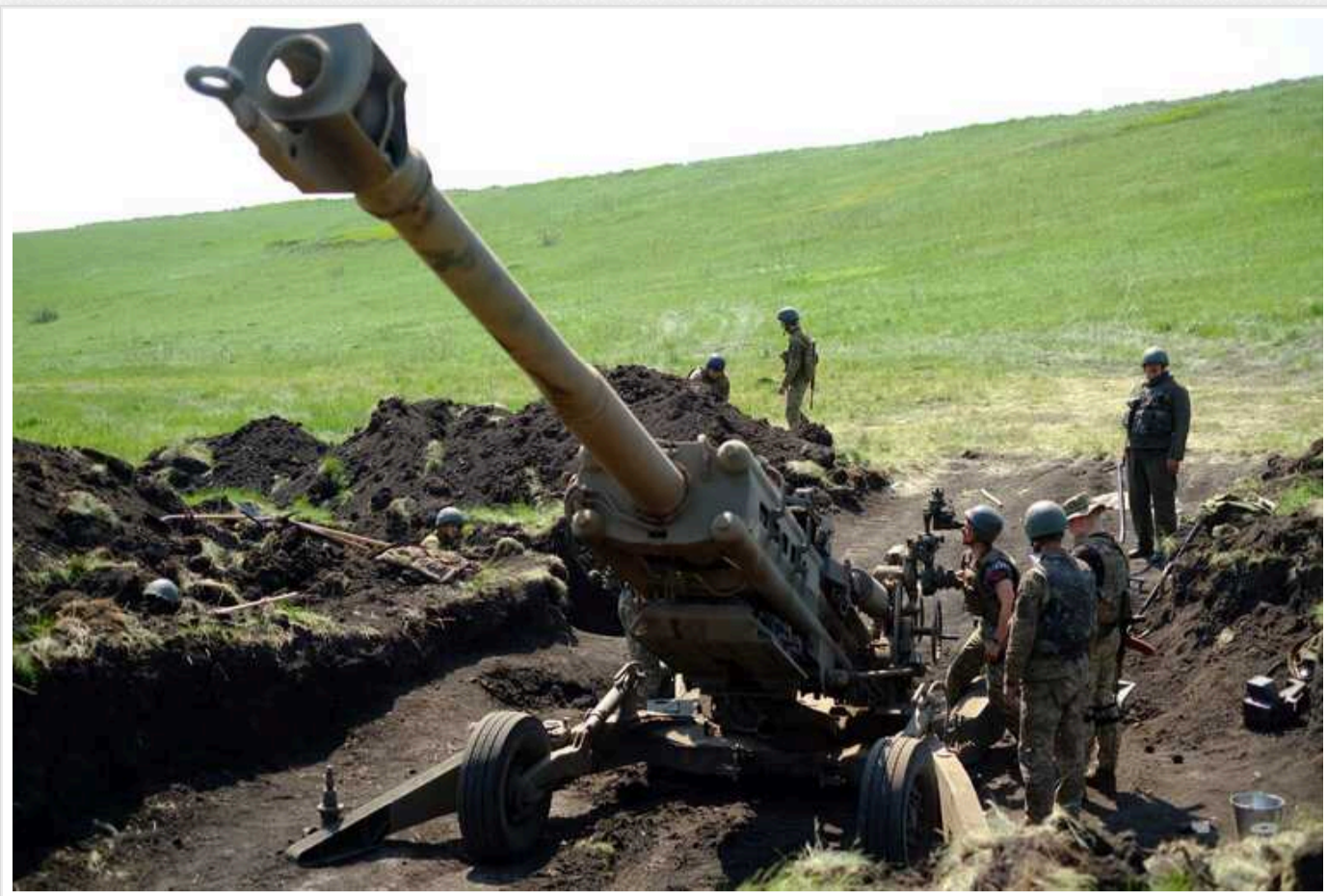
У Великобританії через збільшення попиту відновлюють виробництво гаубиць M777

Британська збройова компанія BAE Systems у четвер, 4 січня, підтвердила підписання контракту з армією США на виробництво гаубиць M777, попит на які зріс після активного використання Збройними Силами України проти росіян.